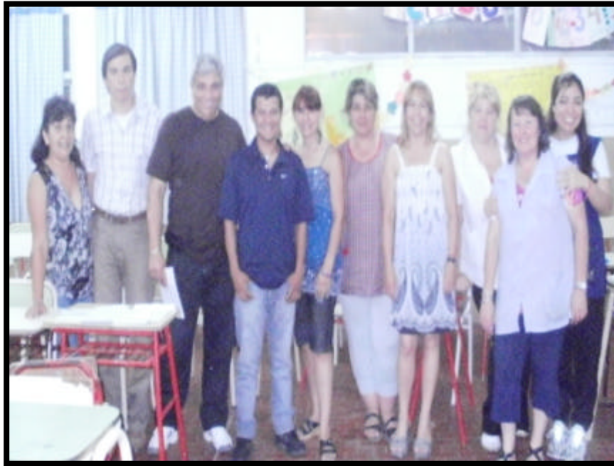
Grupo de docentes de la Escuela Nocturna para Adultos N°2579 Fuente: fotografía obtenida de las observaciones realizadas en la Escuela Nocturna N° 2579. 25/04/12.