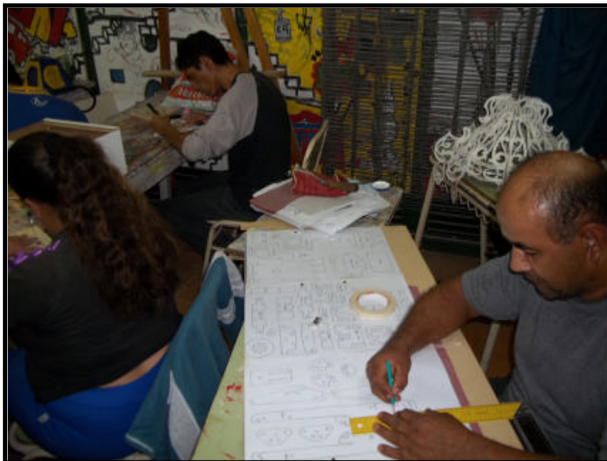
Grupo de alumnos de la Escuela Nocturna N°2579 especialidad electricidad. Fuente: fotografía obtenida de las observaciones realizadas en la Escuela Nocturna N° 2579. 25/04/12.