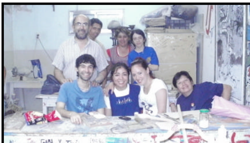
Grupo de alumnos de la Escuela Nocturna N°2579 especialidad electricidad. Fuente: fotografía obtenida de las observaciones realizadas en la Escuela Nocturna N° 2579. 25/04/12.

Permite a los alumnos nutrirse de la diversidad sectorial, cultural y sociológica; y aunque es de alcance nacional, su funcionalidad depende de la atención que preste a las necesidades y características regionales y locales.