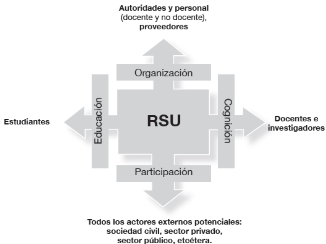
Gráfico N° 1: Actores directamente interesados en la práctica de la RSU 2

En el Grafico N°1 que compartimos a continuación podemos observar, los impactos, así como también a los interesados que participan directamente en cada uno de estos impactos.