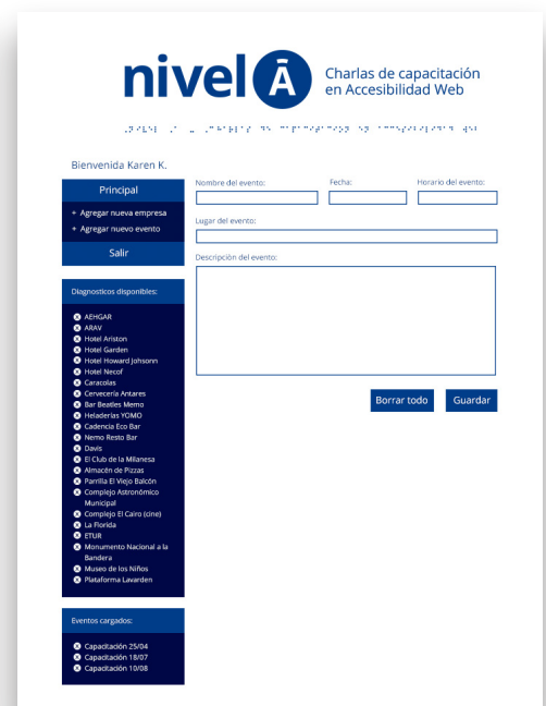
Sitio para administrar eventos y diagnóstico de las empresas