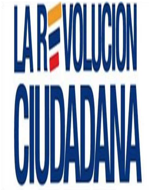
Logo de campaña Alianza PAIS 2006.

El segundo eje programático refiere a la Revolución ética y la lucha contra la corrupción.