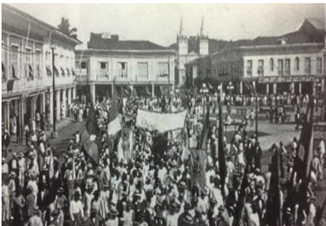
Revolución Juliana: militares y obreros marchan hacia el palacio de gobierno.

En 1925, se produce la “ Revolución Juliana ”. Los sucesivos presidentes caudillistas, el predominio de la banca de Guayaquileña sobre las decisiones presidenciales, la postergación de los intereses de la clases trabajadora, las elecciones fraudulentas de Baquerizo Moreno, Tamayo y Córdova, más la crisis económica derivada por la caída de las exportaciones del cacao, provocaron una revuelta de militares rebeldes. Esto fue así, porque las fuerzas políticas ya lo habían intentado sin ningún resultado y la fuerza proletaria estaba debilitada después de la represión de 1922 y 1923. La cúpula castrense se encontraba a merced del gobierno de turno, es por ello que el levantamiento de las líneas intermedias provocó total acatamiento al resto del ejército de toda la República. Esta junta de militares progresistas reivindicó la Constitución de 1906, creó el Banco central de Ecuador, promovió la regulación laboral de los trabajadores del sector privado y público (Ayala Mora, 2008).