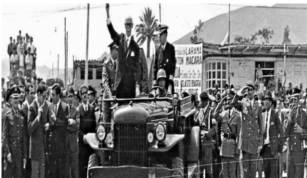
Velasco Ibarra camino a su primera asunción

tribunal electoral, también un tribunal de garantías constitucionales, se reconoció autonomía de las universidades, redujo el congreso a una sola cámara e incorporó un diputado como representante de las comunidades indígenas (Ayala Mora, 2008). Pero entrado el año 1946, la