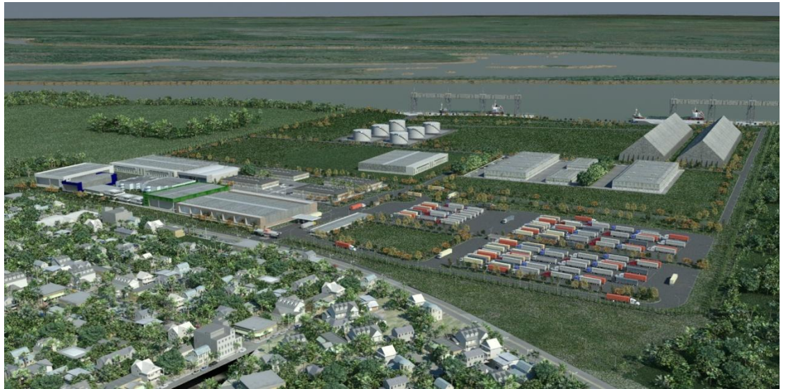
Durante los primeros 18 meses de la concesión, Zofravía desarrollará 10 de las 57 hectáreas totales, superando las expectativas impuestas en el pliego de licitación.