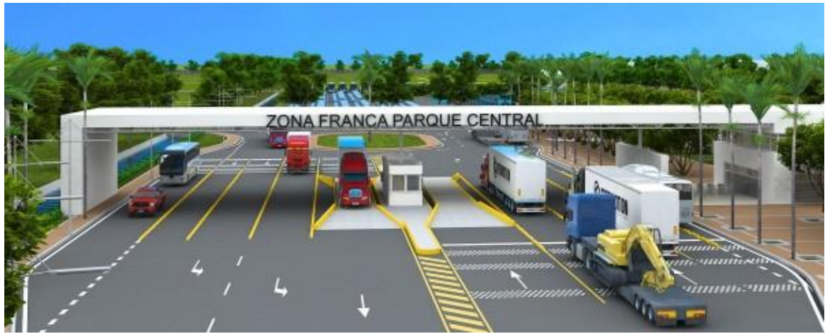
Entrada y salida de vehículos dentro de la Zona Franca, representación del Parque Central.