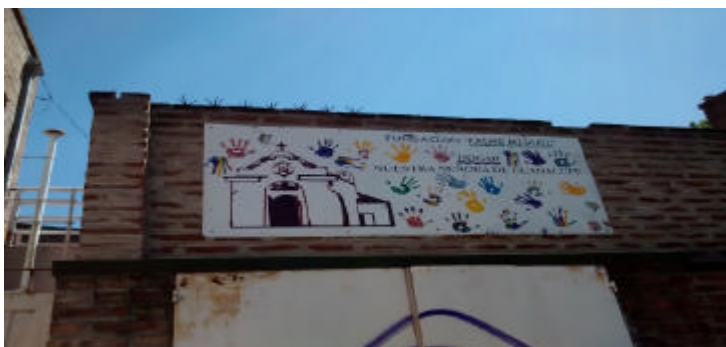
Imagen2: Cartel que se encuentra en la entrada con imagen misionera y solidaria.

Al llegar al hogar, la vista muestra una pared alta de ladrillos, un portón pequeño y un portón de garaje, ambos de color blanco, en el medio y arriba un cartel con el nombre del lugar (imagen 2). Desde la vereda no se puede ver nada hacia adentro, hay un timbre para llamar que suena muy fuerte.