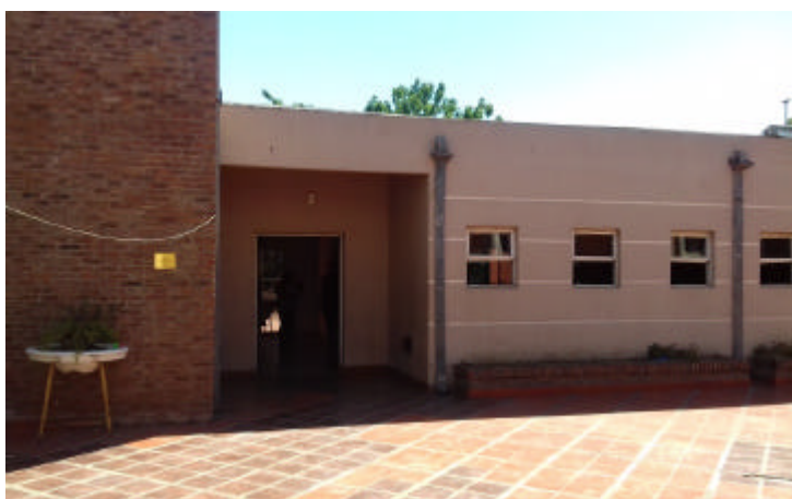
Imagen 3: Patio delantero. Es el ingreso habitual.

Se ingresa por un espacio al aire libre, un patio delantero (imagen 3) donde el piso es de cerámicas rústicas muy prolijas. Hay un sector con pasto, un lindo árbol y algunas plantas, lo que hace de dicha entrada un lugar agradable. A continuación, se ingresa al edificio por una puerta amplia con vidrio que suele permanecer abierta. Al final del pasillo se encuentra la oficina de la directora, la cual tiene dos divisiones, en la primera hay un escritorio con dos sillas y una computadora; y en la otra cruzando una puerta, un sector privado, donde está el escritorio de la directora, tres sillas y los archivos con las carpetas de cada residente, acomodados en una pequeña biblioteca, alrededor se puede ver un poco de desorden de papeles y cosas amontonadas. En ese lugar es donde hablé conmigo la primera vez y donde hablaban también con la secretaria cuando no querían que las escuchen las chicas que continuamente estaban dando vueltas.