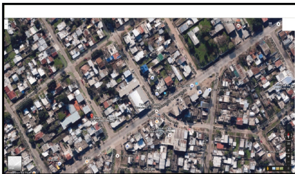
Imagen 9: Mapa satelital del barrio donde está ubicado el Hogar Nuestra Señora de Guadalupe.