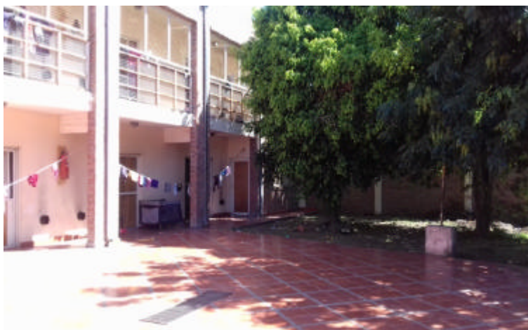
Imagen 5: Patio trasero donde se aprecia un árbol frondoso.

Contiguo al comedor, hay una puerta ventana por donde se sale hacia el patio trasero (imagen 5), el cual es muy amplio, en una parte hay piso de cerámicas y en otra pasto, en ese lugar lavan y cuelgan la ropa, algunas también tienen un tendedero en las habitaciones que tienen balcón. Se nota que están armando una huerta al fondo del patio, cuando pregunte sobre la misma, las chicas me comentaron que la están armando los sábados “ con unas personas que vienen como voluntarios ”, parecen muy contentas con la realización de la huerta, pareciera que es algo que las entretiene y distrae.