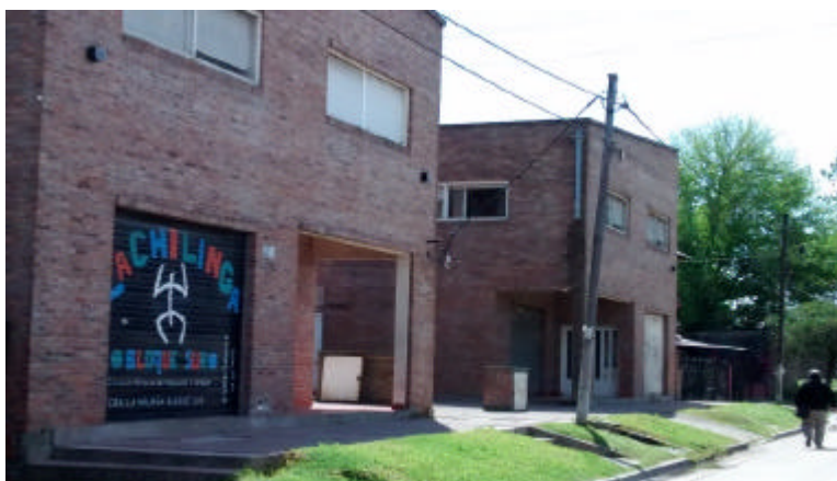
Imagen 1: Frente del hogar Nra. Sra. de Guadalupe, con su ingreso prolijo, de buen gusto y locales comerciales al frente.

Así fue, como ese día viernes a las 15:00 hs. llegué al hogar “Nra. Sra. de Guadalupe”, ubicado en la calle Cerro Aconcagua 2153 8 , a media cuadra de una Avenida bastante transitada llamada Av. Senzabello, en el partido de Florencio Varela 9 , Provincia de Buenos Aires. Las calles están asfaltadas alrededor del hogar, en el cual de afuera se ve un paredón de ladrillos a la vista rústicos y dos portones blancos. El barrio parece ser de gente de nivel socioeconómico entre medio y bajo. Las casas resultan modestas en general, no siempre están terminadas, abundan revoques sin pintar, techos de chapa, hormigón a la vista sin terminar, las pocas veredas son de cemento alisado (seguramente realizado por el dueño de manera casera), dado que la mayoría solamente tienen pasto. Si bien hay cordón de vereda, en varios lugares hay un poco de basura y suciedad. En ese contexto, se destacan los volúmenes cúbicos de ladrillos, muy prolijos del hogar.