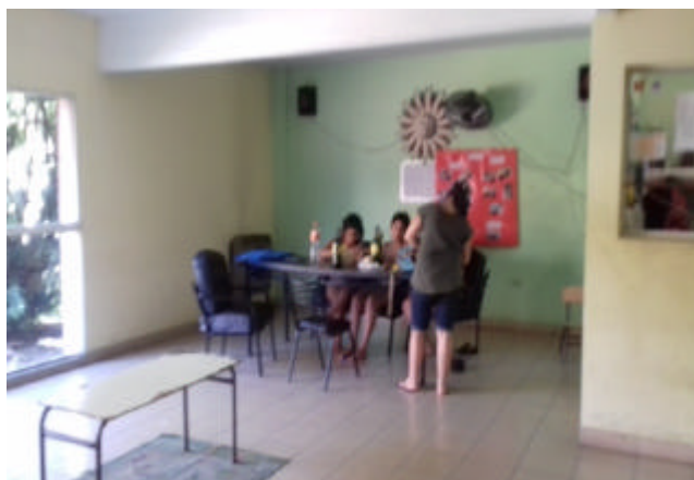
Imagen 7: Sala de usos múltiples. Las adolescentes realizan manualidades para las fiestas de fin de año.