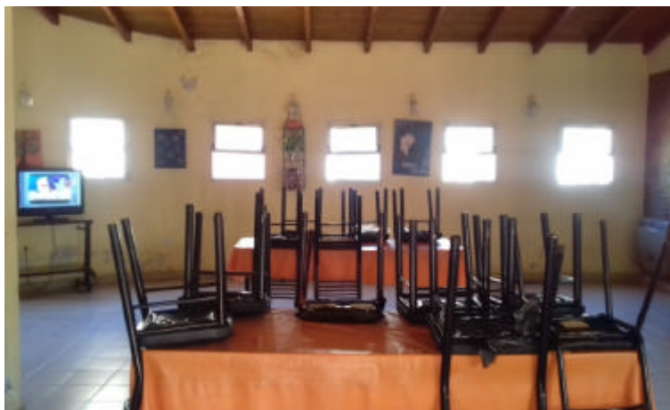
Imagen 4: comedor comunitario, bastante austero.

Siguiendo con la descripción, a mano derecha de la entrada se encuentra el comedor, el cual es un lugar muy amplio, siempre lo vi higienizado como al resto del edificio, allí hay dos mesas largas y una mesita con un televisor, el cual siempre esta encendido y algunas chicas mirando novelas o videos de música (imagen 4). Siguiendo el comedor esta la cocina, la cual tiene una cocina grande, estilo industrial, una mesada de mármol alrededor de toda la pared, bajo las mesadas hay cortinas y en algunas partes se pueden ver bidones y ollas, también hay dos heladeras.